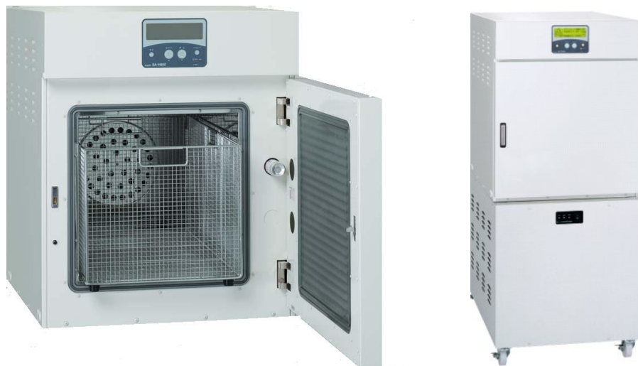
※酸化エチレンガス除去装置 搭載仕様